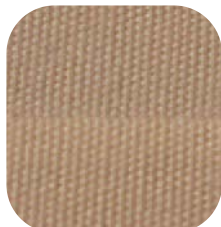
Gros plan sur toile thermo-collée

Distribution : Revendeurs - installateurs, poseurs agréés, de la gamme Abrivoile ® - Abritez-vous chez nous.